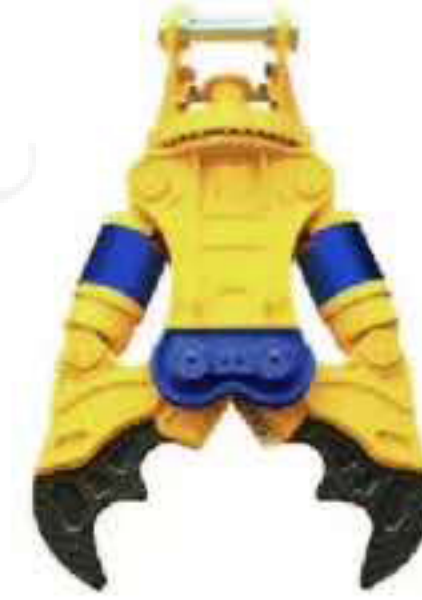
液压剪 Hydraulic Shear