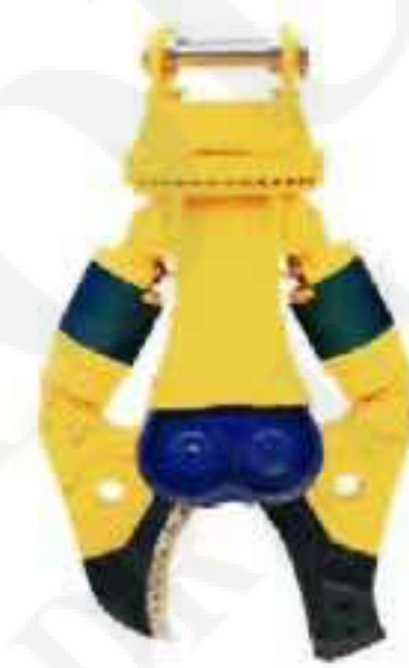
液压剪 Hydraulic Shear