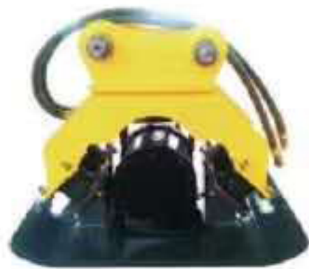
振动夯 Hydraulic Compactor