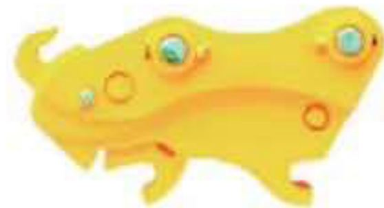
快速连接器 Quick Hitch