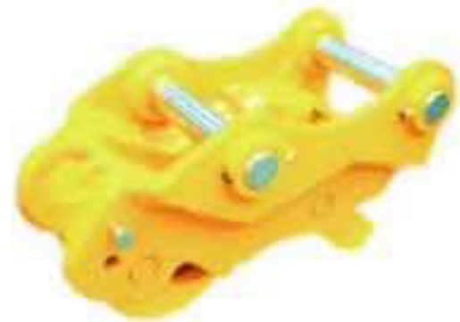
快速连接器 Quick Hitch